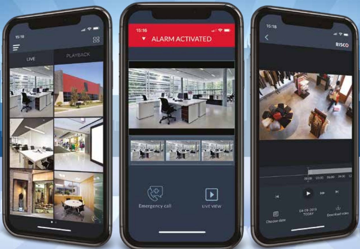
Vídeo en vivo

Maximizando la seguridad mediante alarma y vídeo integrado