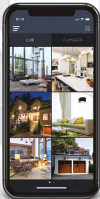
Vídeo en vivo

El CCTV tradicional ofrece dos funcionalidades principales: visualización en tiempo real y reproducción de la grabación. VUpoint agrega un tercer elemento clave: notificación de alarma en tiempo real con imágenes y clips de vídeo de 30 segundos que son enviados directamente al dispositivo móvil. Esta notificación de alarma en tiempo real, con evidencia visual desde la cámara correspondiente en el momento adecuado, permite al usuario y a la central receptora de alarmas tomar las medidas adecuadas de forma inmediata.