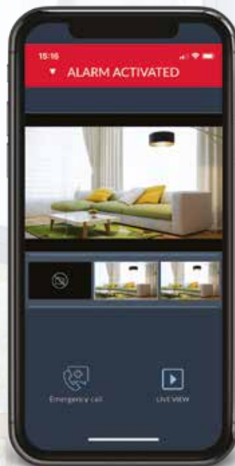
Verificación de alarma