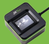
Requiere enrolador SLK20R